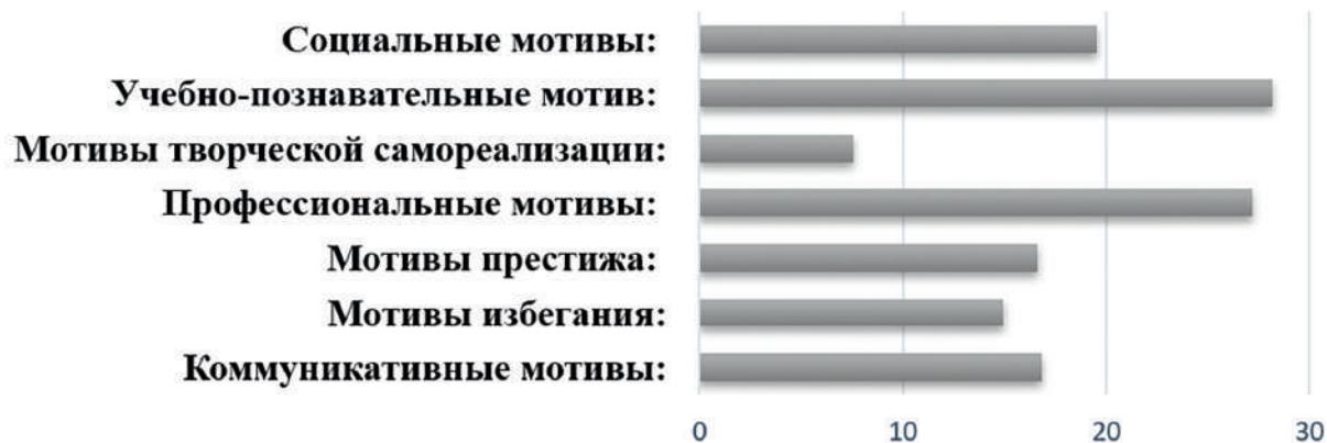
Диаграмма 1. Результаты 1 этапа исследования учебной мотивации

К удивлению низкой оказалась мотивация творческой самореализации равный – 7,58 балла. Е.Л. Солдатова и другие отмечали необходимость для творческой личности не только чувствительности к противоречиям и внутренней мотивации к деятельности, но и владение большим объемом информации и способности переносить освоенное на новый материал, использование альтернативных путей поиска информации [3, 4].