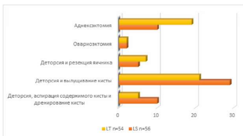
Рис. 3. Объем вмешательств при перекруте образований яичника.