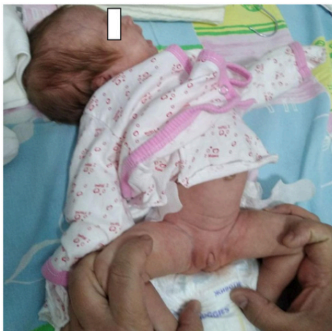
Рисунок-1. Наружные гениталии девочки с ВДКН. Клитор penisообразный. Большие половые губы образуют складчатую «мошонку».

Окончательный диагноз: Наследственно – генетическое заболевание.