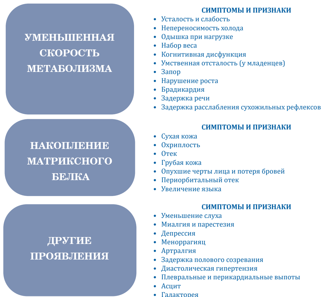
Рис. 2. Симптоматика гипотиреоза.

- Свободный Т4 – помогает подтвердить диагноз: низкое содержание Т4 на фоне высокого показателя ТТГ свидетельствует о первичном гипотиреозе. При низком уровне ТТГ и Т4 в амбулаторных условиях предполагают центральный гипотиреоз [32,36].