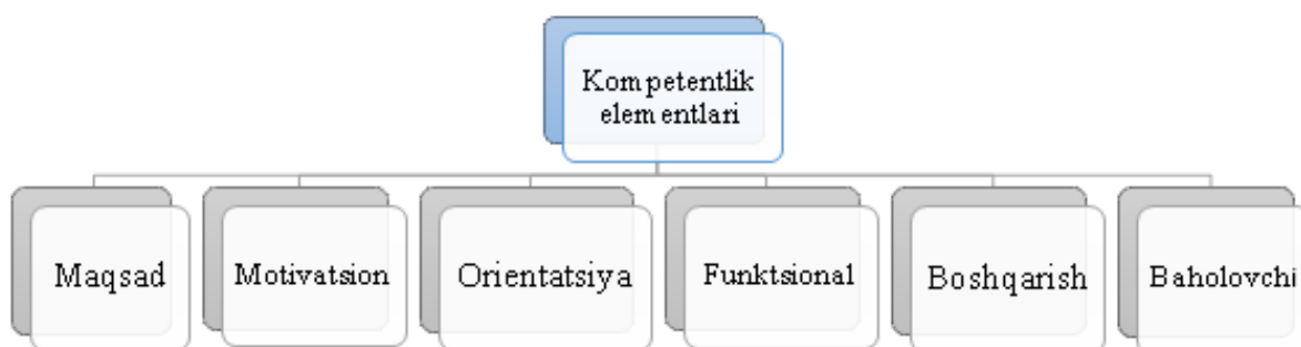
2-rasm. Kompetentlik elementlari

Kompetentlikning strukturasi quyidagi elementlardan iborat[1]: